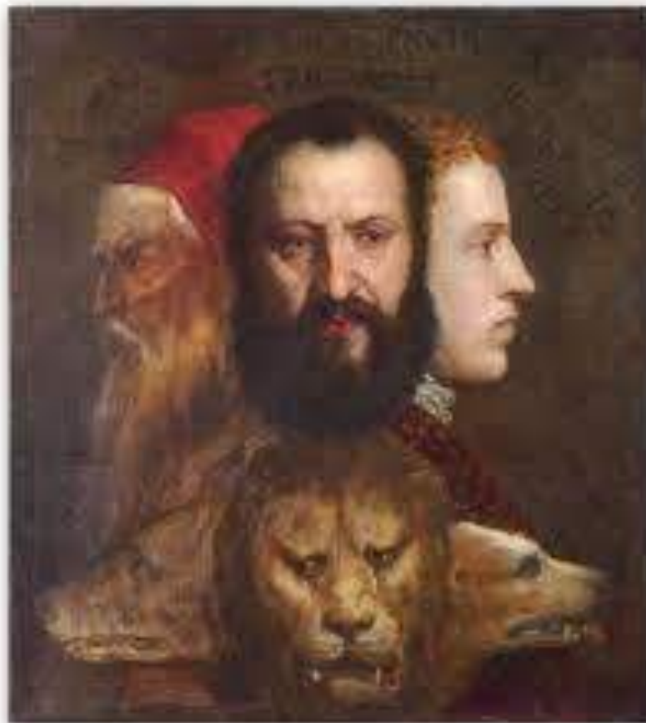
“Alegoría de la prudencia”. Tiziano

Se relaciona con la lógica en cuanto estudia enunciados o premisas, pero no desde el punto de vista de su corrección formal. También se vincula con la retórica, que tiene que ver con el discurso adecuado para lograr el convencimiento.